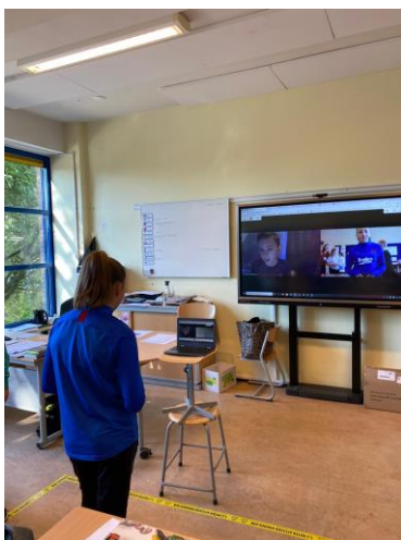
Foto van een klasbouwer "op afstand;" 1 leerling in de klas en 1 leerling thuis

De kinderen en leerkrachten moeten weer even aan elkaar wennen en dus zullen er regelmatig klas- en teambouwers uitgevoerd worden. Met behulp van het bord in de klas zal er in elke groep dagelijks aandacht zijn voor de check-in (en check-out) en worden successen gevierd. Op De Toren vinden we samen leren heel erg belangrijk, daarom kiezen we ervoor om elke groep in zijn geheel naar school te laten komen.